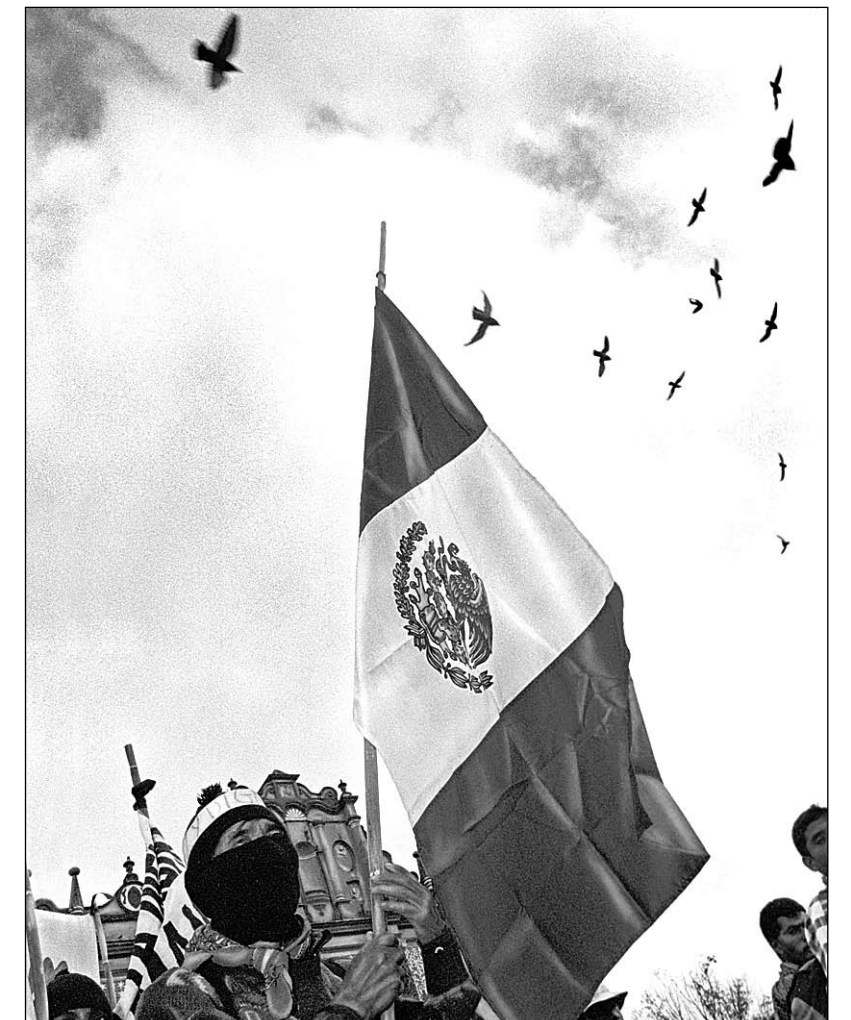
▲ Giorgio Viera