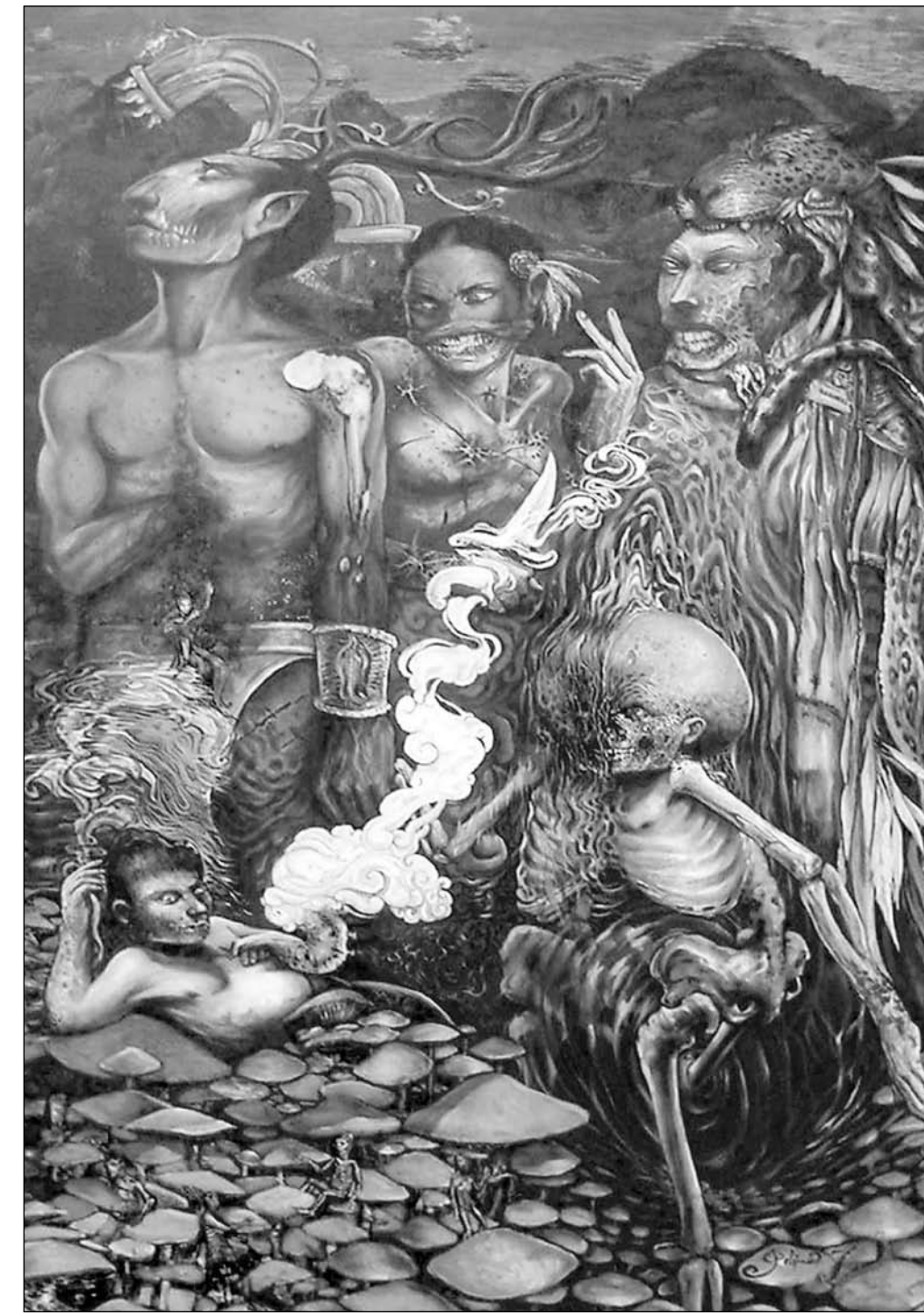
▲ El mensajero de Aztlán