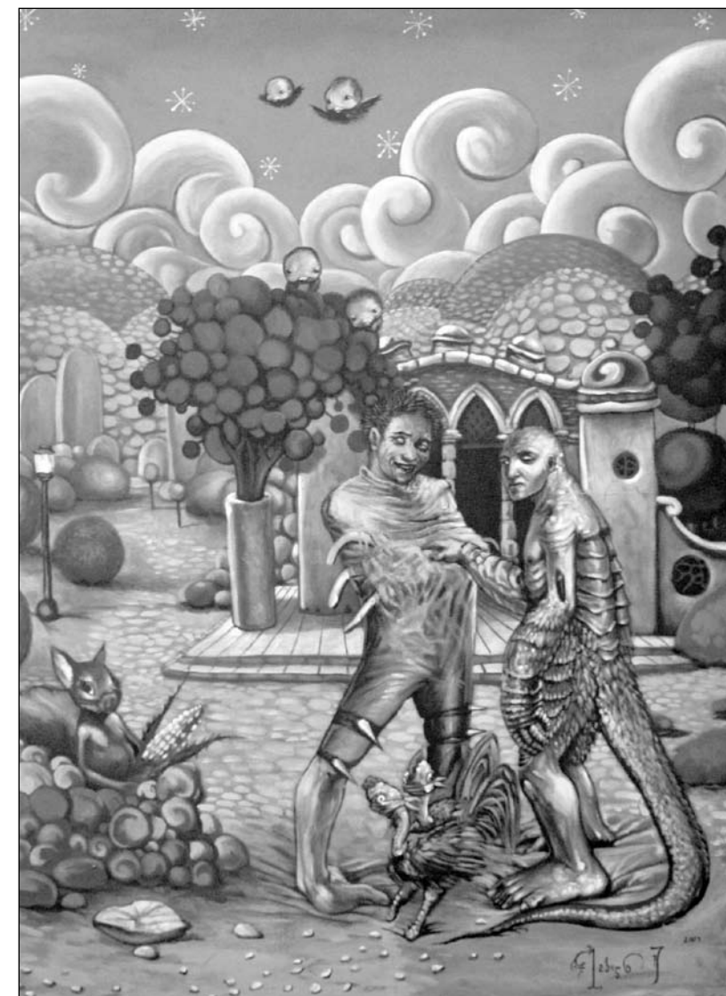
▲ Antes de la catástrofe

El espacio (avenida Vallarta 1668) está abierto de lunes a viernes, de 10:00 a 20:00 horas. Sábado: 10:00 a 17:00. Domingo: 11:00 a 16:00. Concluye el 20 de octubre. Entrada libre. *