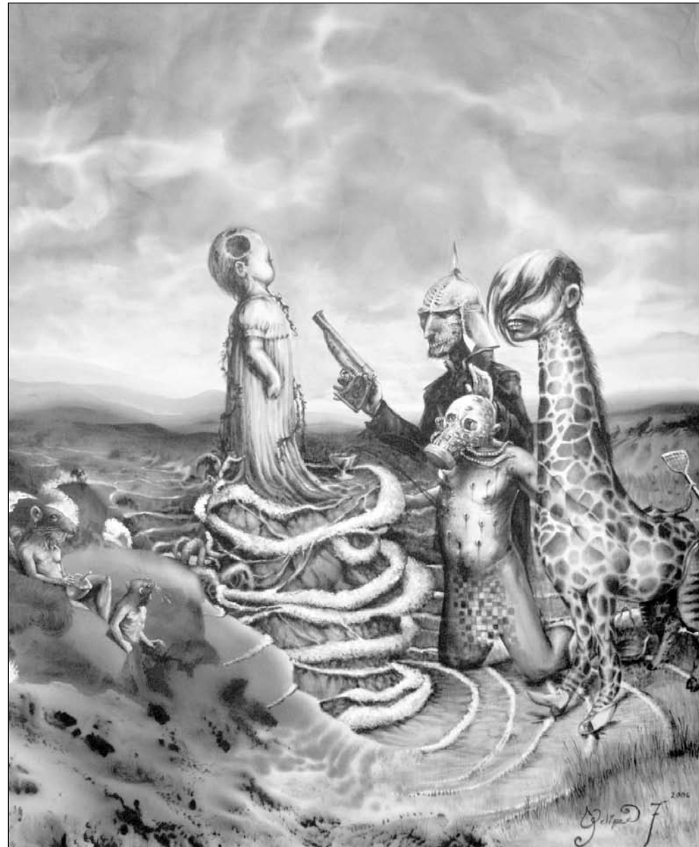
▲ La guerra 2 minas