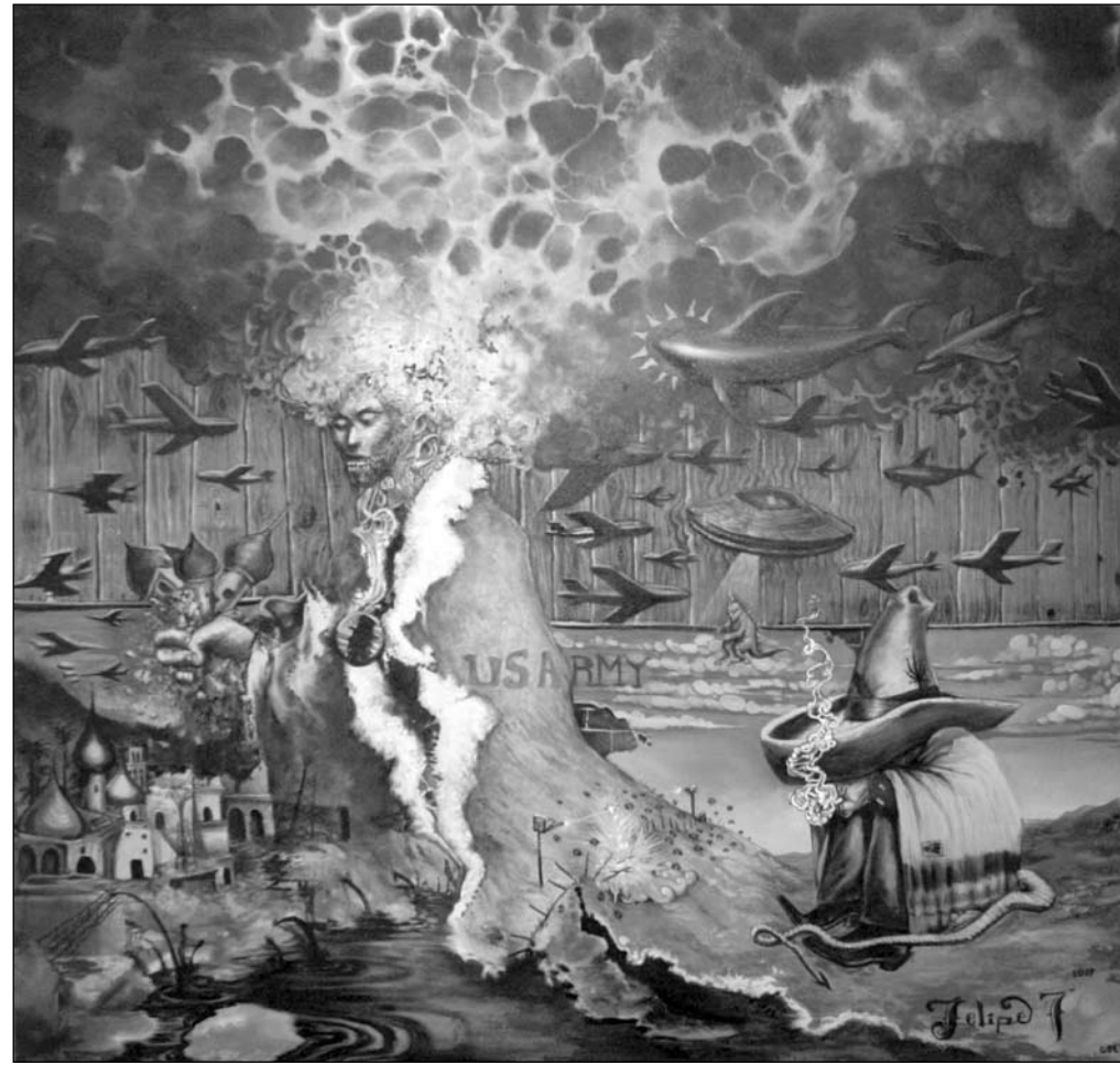
▲ The big brother