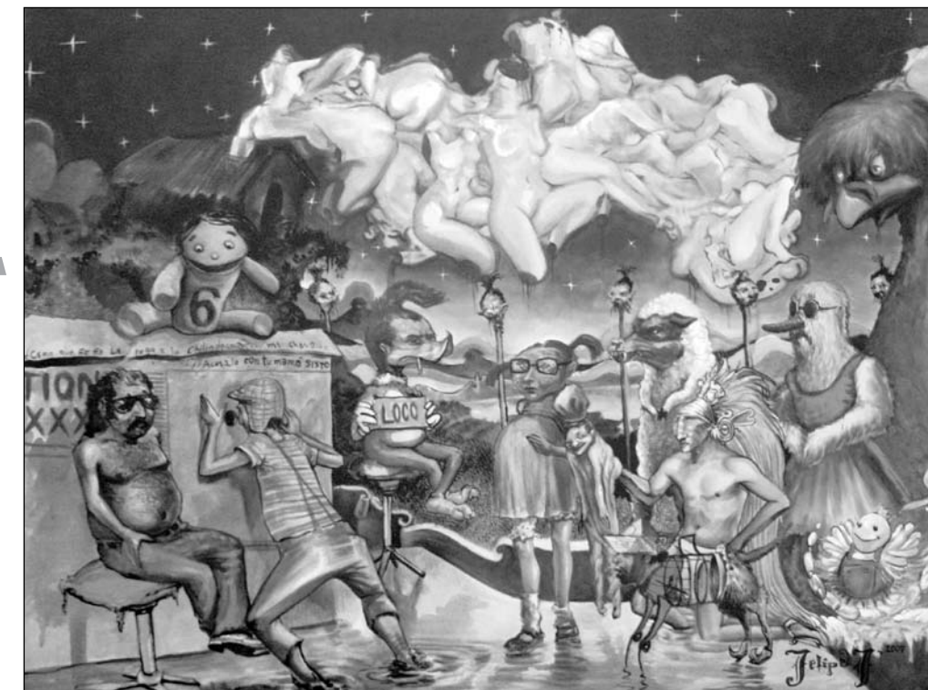
▲ El impostor