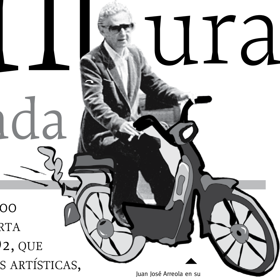
Juan José Arreola en su Caravela. Ilustración: Gaby

LA GACETA, A LO LARGO DE 500 EDICIONES, CRECIÓ EN SU OFERTA HASTA FORMAR LA SECCIÓN O 2 , QUE CUBRE TODAS LAS EXPRESIONES ARTÍSTICAS, NO SÓLO DE MANERA PUNTUAL E INFORMATIVA, SINO DE FORMA CRÍTICA Y HA FUNCIONADO COMO UN REFERENTE PARA EL PERIODISMO CULTURAL EN GUADALAJARA