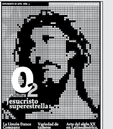
La Limón Dance Company | Variedad de valores en la | Arte del siglo XX en la |