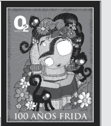
100 AÑOS FRIDA

▲ Número 57, publicado en La gaceta 487.