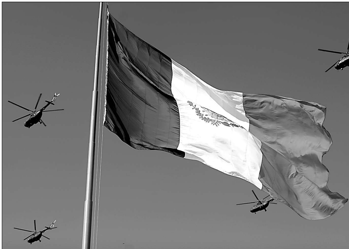
► Bandera en la Plaza de la liberación.