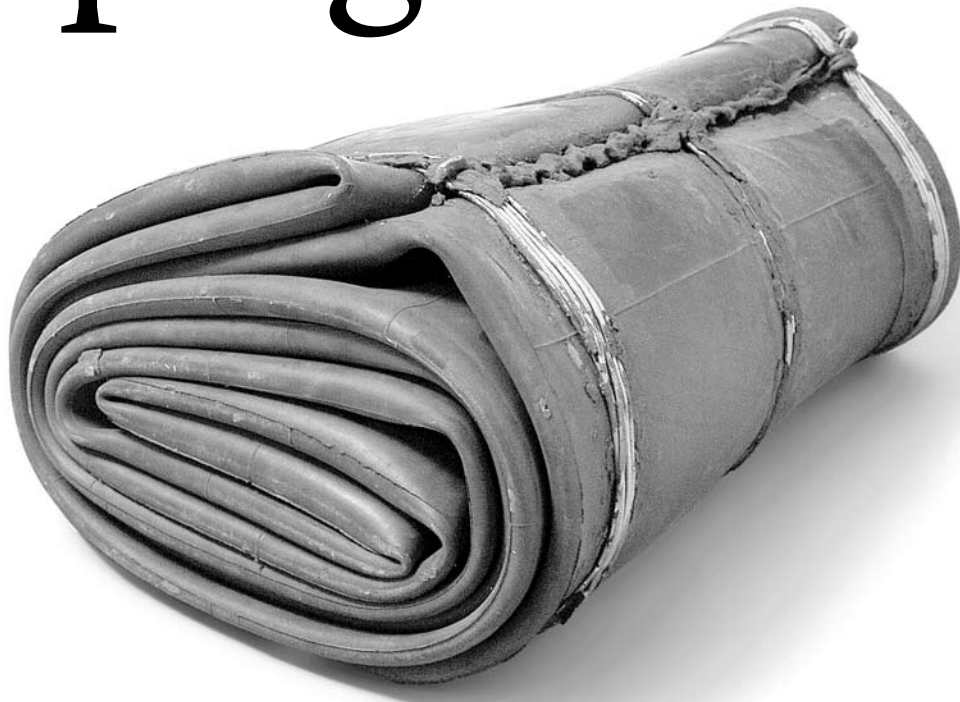
▲ Caucho enrollado, huellas de oxidación con alambre metálico.