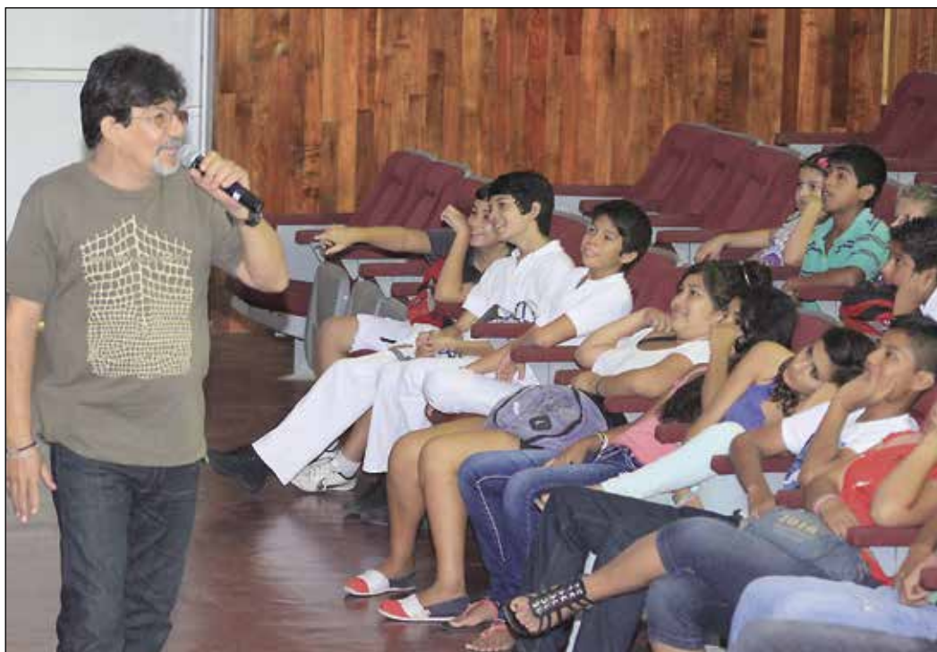
◀ Conferencia del oceanólogo Rafael García de Quevedo.

La difusión y las invitaciones a las conferencias de “Sábados de ciencia” se realizan a través de flyers, de correo electrónico, del perfil de Facebook y de la página de internet del CUCosta. *