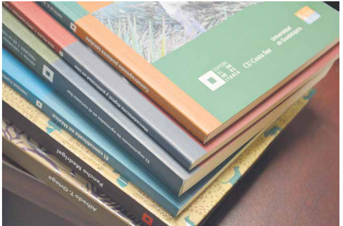
▲ La colección se compone de 25 títulos.

Para el funcionamiento de este proyecto “se tiene un presupuesto que se está generando con recursos del Programa Internacional de Fortalecimiento Institucional (PIFI), y con recursos “que la Rectoría en conjunto con la Secretaría Académica destina de manera periódica para poder generar un fondo, y de ahí subsidiar este tipo de proyectos”. Esto se complementa con recursos del presupuesto ordinario destinado a la parte de comunicaciones, puesto que también se apoya la publicación de artículos científicos y de divulgación en algunas revistas de especialidad y científicas, dice.