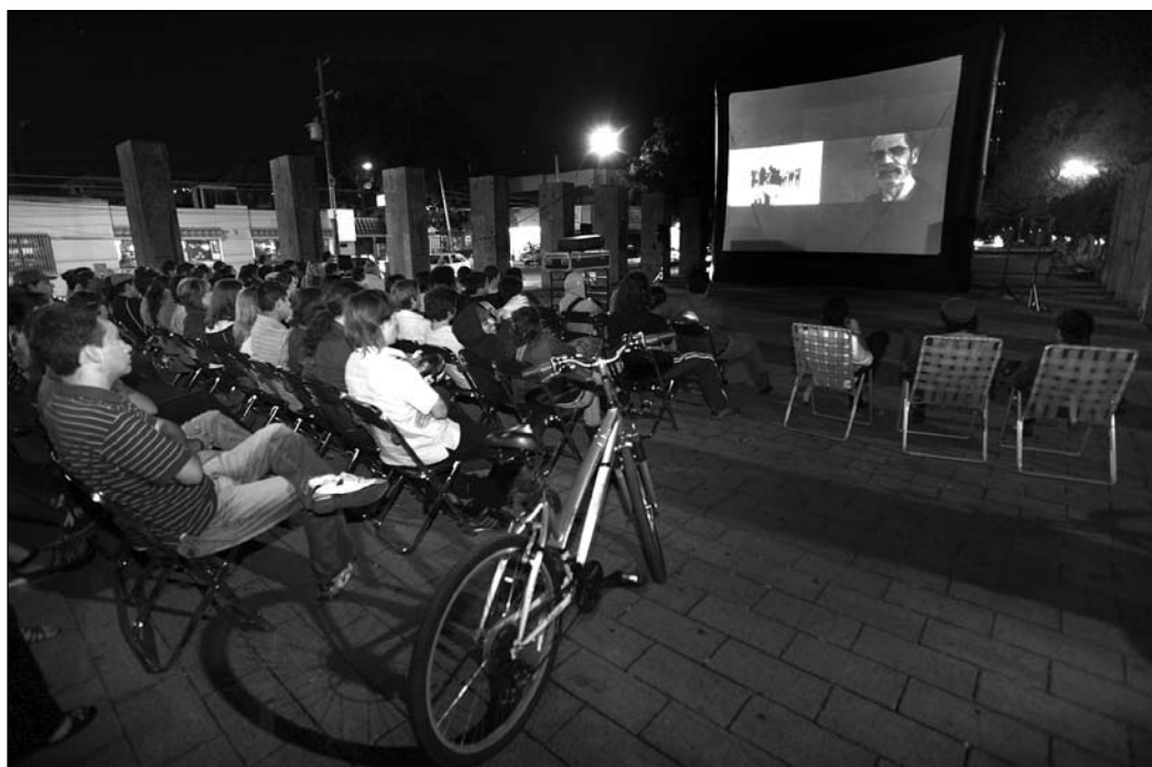
Plaza República fue el escenario de la proyección del filme del cineasta Rogelio A. González.