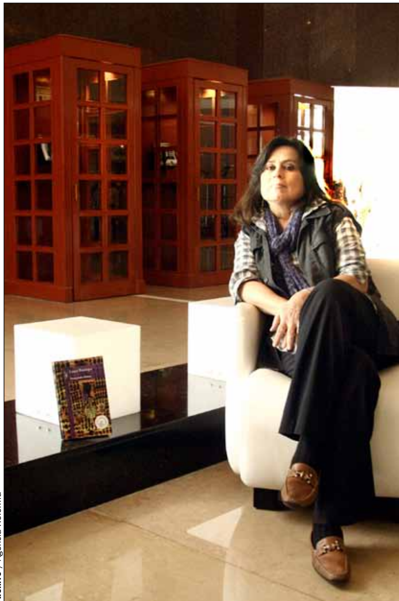
► La escritora colombiana Laura Restrepo.