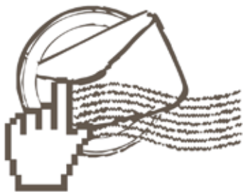
Imagen e identidad docente

Expresa tu opinión. Envía un mensaje a este correo con una extensión máxima de 200 palabras. Debe incluir nombre completo y teléfono. La gaceta se reserva el derecho de edición y publicación