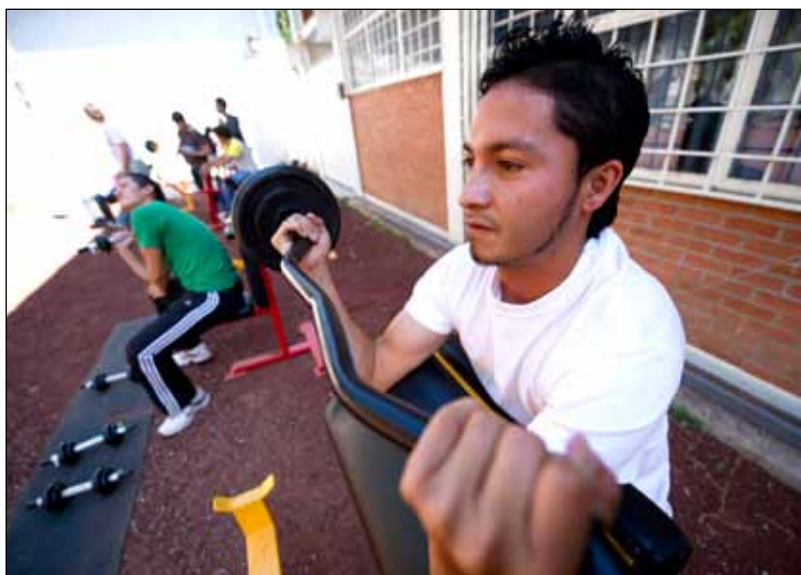
▲ El nuevo muro de escalada y el gimnasio al aire libre del CUCS.

que en un futuro no lejano pretenden proveer con nuevos equipos ambas instalaciones.