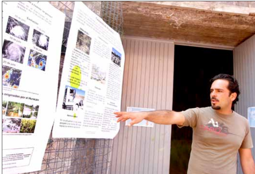
▲ Estudiantes de Geografía presentaron planes y proyectos para el reordenamiento territorial.

“Los accesos para llegar son escasos. En algunos puntos los servicios médicos más cercanos están en Toluquilla. No se les da el enfoque geográfico. Esas tierras son fértiles, tienen mucha agua o mucha arcilla, por lo que se erosionan constantemente. Después de un año las casas se están hundiendo o se empiezan