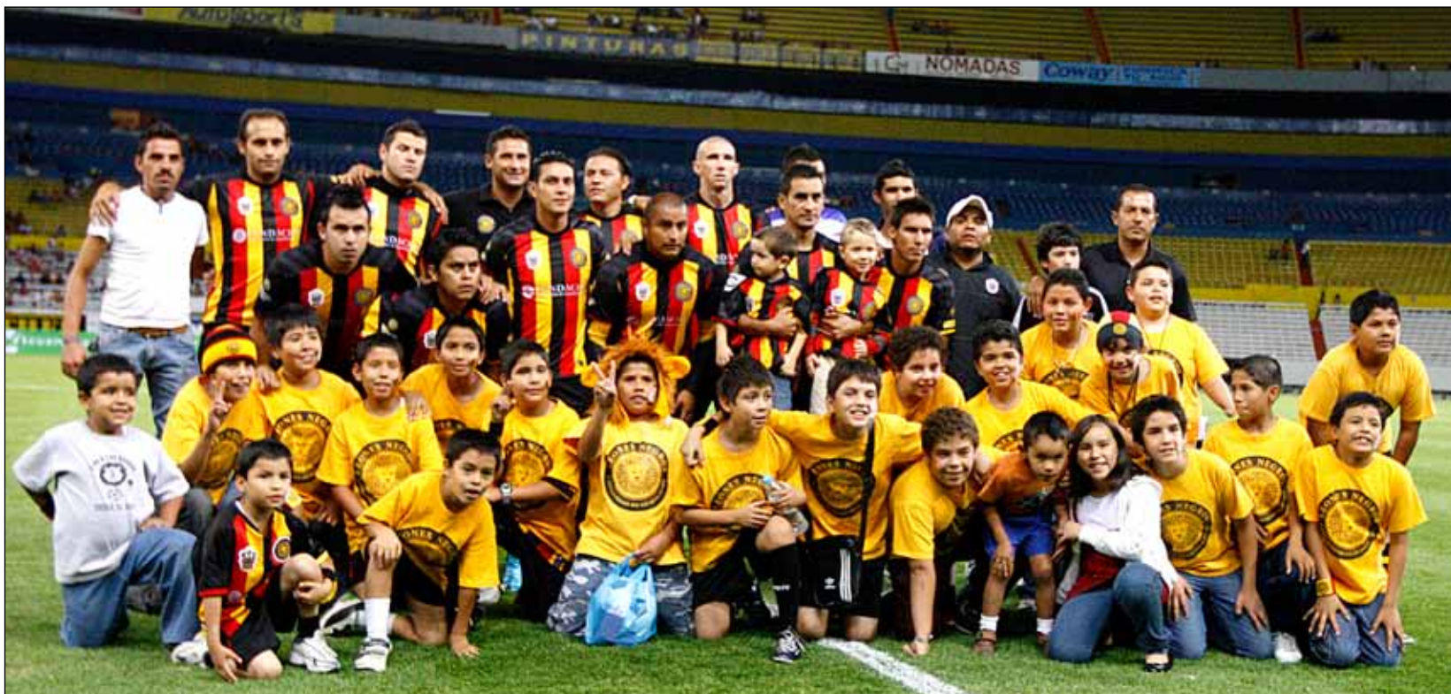
◀ El equipo de los Leones Negros antes de su partido del pasado 15 de abril.