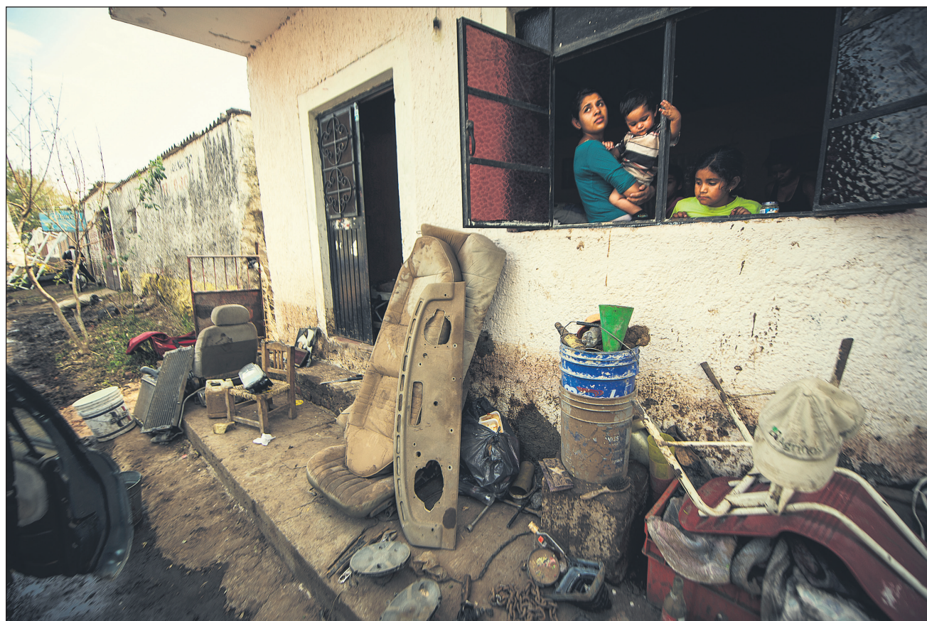
▲ Más de 300 familias de Teuchitlán resultaron afectadas por la tromba que abatió al municipio el pasado 7 de junio.

A mediados de la semana pasada, cinco días